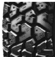
Pneu neige ou Ice

Les pneus typés « neige » ont une bande de roulement très découpée avec des rainures larges et des pavés massifs qui assurent une traction optimale dans la neige profonde. Bruyants, relativement inconfortables, moins précis, les pneus neige ne sont quasiment plus utilisés en France. En relation avec les conditions climatiques locales, ils sont plus répandus en Europe du Nord où ils sont appelés pneus « Nordic » ou « Ice ».